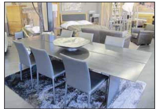
La table en acier Foglia, un produit unique, qui marquera vos convives. A découvrir chez Déco Maison, route Cantonale 19 à Conthey.

Institut Aude, Sion tél. 027 322 23 23 Beauty Center, Conthey, tél. 027 346 60 70 www.aude.ch