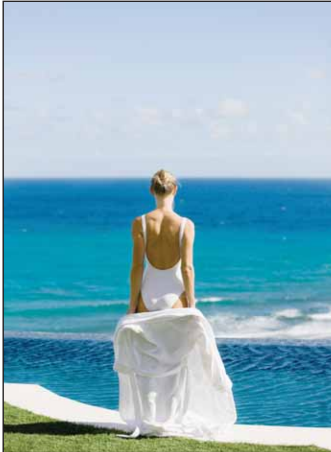
Pour une allure dynamique et gracieuse cet été, les instituts Aude (av. du Midi 8 à Sion) et Beauty Center (Fougères 27 à Conthey) vous recommandent les bienfaits de l'ionithermie.

A l'enseigne de « Je me prends en main! », les esthéticiennes CFC de Fabienne Baud vous pro-